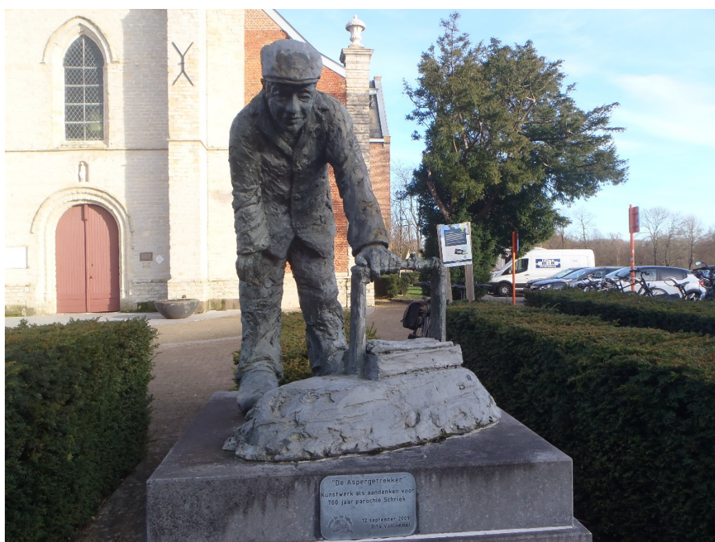
De Aspergetrekker – Schriek (Heist-op-den-Berg).