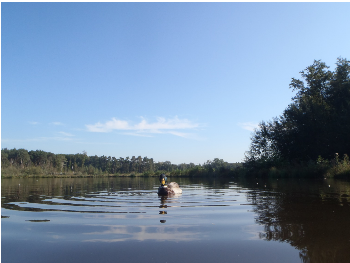
Foto : Wandelen door het water - Bokrijk

Driemaandelijks tijdschrift van de “Belgisch - Nederlandse Wandelverbroeding”